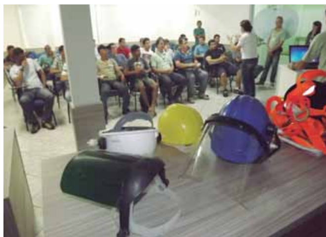
Aulas acontecem n auditório do Sintricomb

As aulas acontecem nas próprias empresas, quando o número é de até dez trabalhadores, ou no