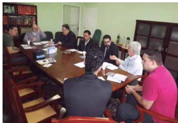
Comissão reunida para discutir realização do Seminário sobre Custeio de Sindicatos

Com início marcado para às 9h30min, o evento terá palestras, debates e a criação do Fórum Estadual dos Trabalhadores. Várias centrais sindicais de trabalhadores, como UGT, Nova Central Sindical e Força Sindical estarão presentes com seus sindicatos filiados. A expectativa da organização é de reunir em torno de 300 pessoas. O objetivo do Seminário é de discutir as freqüentes investidas que o Ministério Público tem realizado na gestão dos sindicatos, com a intenção de retirar dos mesmos direitos assegurados, principalmente nas Convenções Coletivas, e que auxiliam as entidades a manter seus serviços.